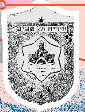
ראש העיר גייס ליעצוב הסמל את האמן הצעיר שחזר מצרפת