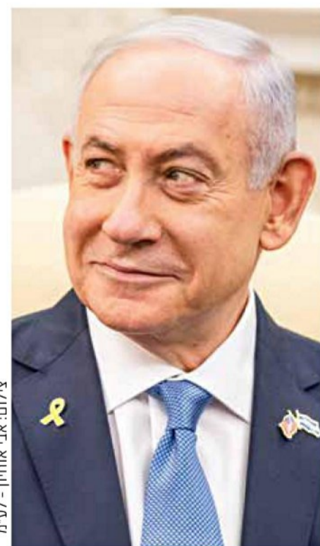
רוצה להיות צ'רצ'יל. נתניהו