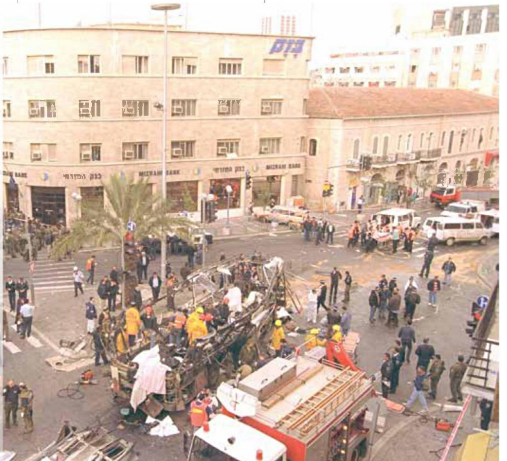
"הכרה בבית לאומי לעם היהודי בארץ ישראל לא נכללה בהסכם אוסלו. ואז התחילו הפיגועים". הפיגוע בקו 18, מרץ 1996