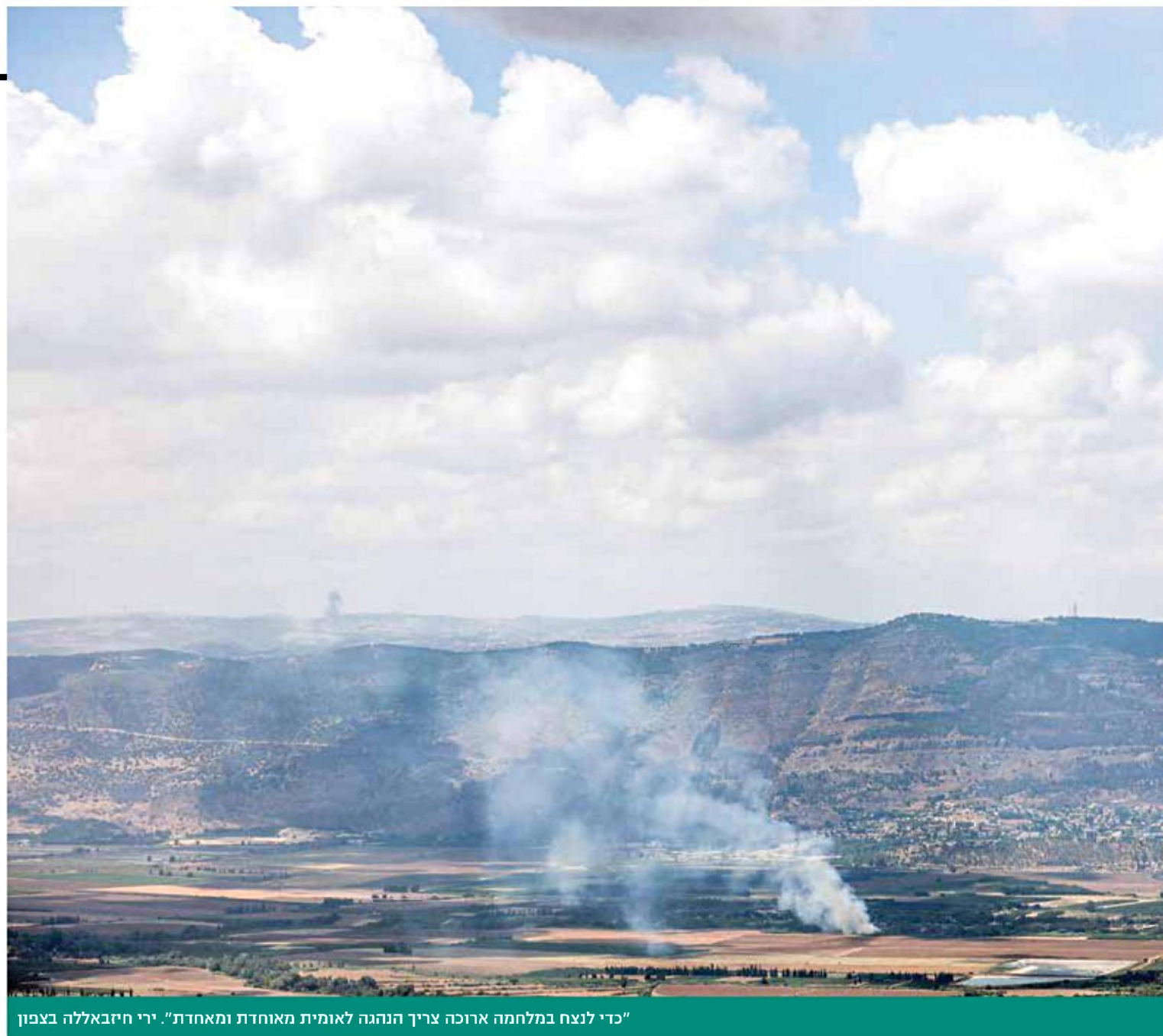
"כדי לנצח במלחמה ארוכה צריך הנהגה לאומית מאוחדת ומאחדת". ירי חיזבאללה בצפון

החלוקה, אבל מצליח להרחיב את גבולות ישראל. היה להם התחכום הזה".