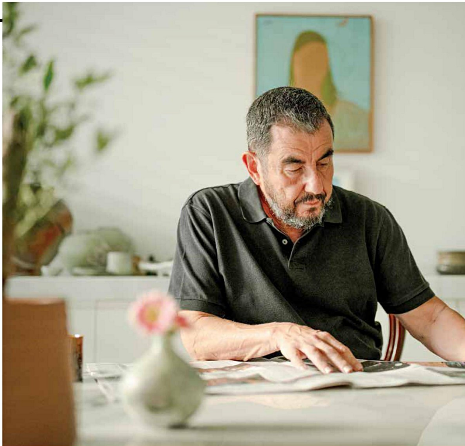
"אני חי שנים בדאגה ממלחמה מתקרבת". ארי שביט

את הרל"ביסטים, אבל אני רואה את הטררגדיה. לא נמצאה בנתניהו הגדולה לצאת מהקורבנות ולחדש את הממלכתיות בצורה נכונה".