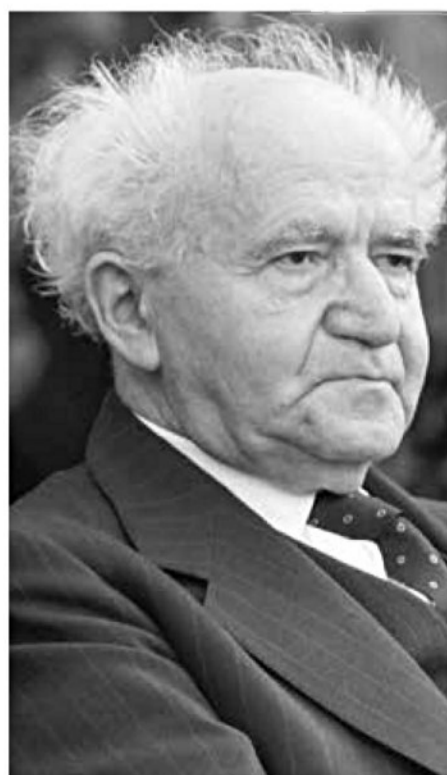
הבין שאסור לעשות טעויות. בן-גוריון