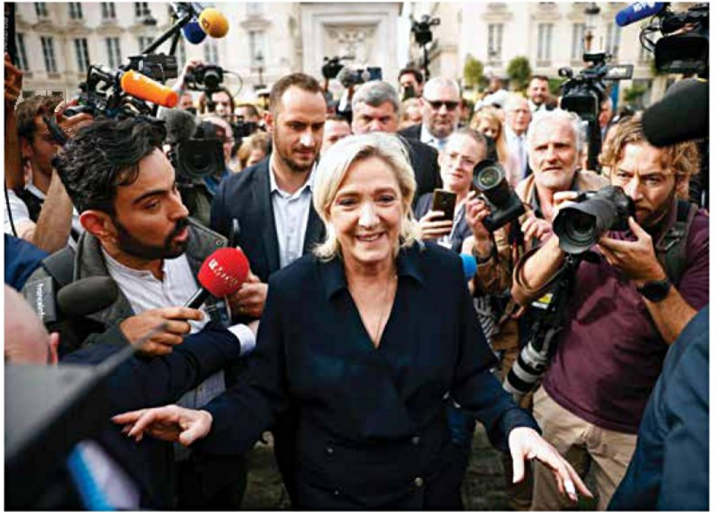
"ישראל חייבת לנהל קשרים ישירים איתה". מארין להפן

בעיניו, העיסוק בתולדות היהודים בארצות האסלאם עשוי להעניק לגיטימציה מחודשת לציונות. "גירוש היהודים מארצות האסלאם מהווה עדות לחילופי אוכלוסין היסטוריים, ממש כפי שקרה בסכסוכים אחרים בעולם באותה תקופה של מלחמת העצמאות, כמו בין טורקיה ליוון או בין הודו לפקיסטן. או כמו שהפליטים הפלסטינים המשך בעמ' 17 <<