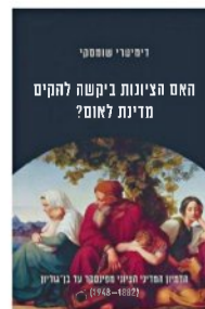
האם הציונות ביקשה להקים מדינת לאום? דימיטרי שומסקי הוצאת מאגנס, 279 עמודים

אינו עוסק בדמויות שוליות או עלומות, אלא מתמקד בדמויות המרכזיות ביותר של התנועה הציונית: החל מאחד מראשי "חייבת ציון", יהודה לייב פינסקר, דרך האבות המייסדים בנימין זאב הרצל ואחד העם, ועד זאב ז'בוטינסקי ודוד בן-גוריון – המנהיגים של שני הזרמים העיקריים בציונות בתקופת המדינה שבדרך ואחריה. לטענת שומסקי, אף אחד מהאישים האלה לא ראה בעיני רוחו את מדינת הלאום היהודית שאנו מכירים. שומסקי עוסק בהיסטוריה אינטלקטואלית, ובהתאם לכך הוא מתעמק בכלל הכתבים של ההוגים שאותם הוא חוקר, כולל אלה המוקדמים והנשכחים. זאת בעצם המטודולוגיה הבסיסית שלו: הוא אמנם עוסק בדמויות מרכזיות ומוכרות, אך מתמקד בדרך כלל בפרקים הידועים פחות בכתיבתו. כך, למשל, הפרק הראשון עוסק בכתיבתו הבלתי מוכרים של פינסקר, לפני החיבור המפורסם "אוטואמנציפציה!" מ-1882. באמצעות הטקסטים האלה מראה הפרק שפינסקר דווקא הטיף להשתלבות של היהודים באימפריה הרוסית, מבלי לוותר על זיקתם הלאומית לבני "השבט היהודי".