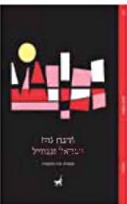
תיבת נוח ישראל זנגוויל מאנגלית: עודד וולקשטיין תשע נשמות, 2024, עמ' 92

מרדכי עמנואל נוח נולד בפילדלפיה בשנת 1785, פחות מעשור לאחר הקמת האימפריה העתידית. מושפע מערכי החירות האמריקניים, החליט נוח לצרף את היהודים הנרדפים לפרויקט האמריקני, לפחות באופן זמני, עד שיוכלו לשוב לארצם. הוא האמין באמת ובתמים כי רק בארה"ב ימצא העם היהודי מנוח. בראשית המאה ה־19 הוא נשא נאום