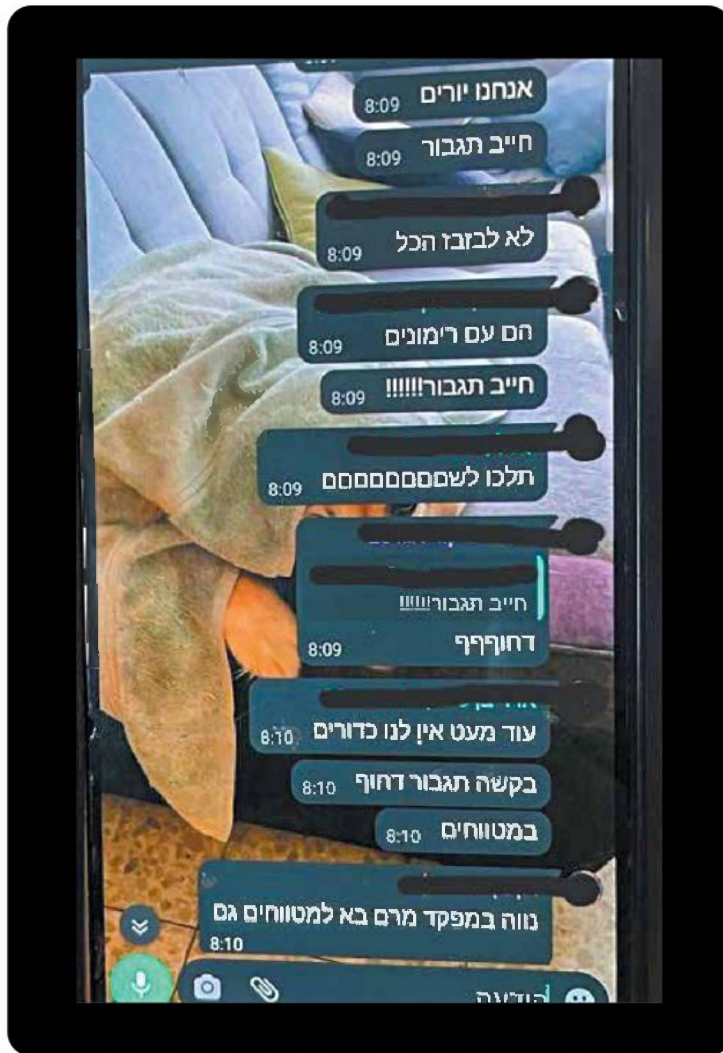
קרב גבורה שהציל רבים. תכתובות הוואטסאפ בקבוצת המפקדים

כתב שם ינאי. "מישהו פעם אמר לי שלאהוב את החיילים שלך זה כמו שריר, ושאת תאמן אותו מספיק, אתה תצליח לאהוב את כולם. אני מתכוון ליישם זאת עם המחלקה שתגיע. (...) בכך שנאהב את חיילינו והם ידעו שאנו אוהבים אותם, הם אוטומטית יתפכו להיות חיילים ולחמים יותר טובים".