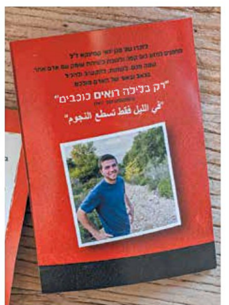
"כמו שינאי נהג לעשות". ההזמנה לשיח בין אנשים עם דעות שונות, על כוס קפה