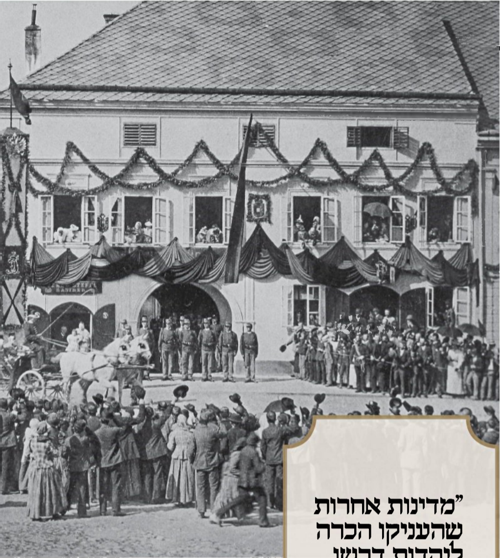
ציוויליזציה שנרמסה תחת רגלי הגרמנים והרוסים, אבל שרדה. ההונגריה, סוף המאה ה-19