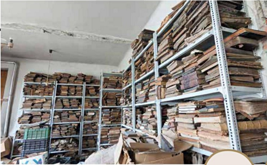
קהילה קטנה עם עבר מפואר. הארכיון היהודי המתהווה. למטה: שורק מדריך את חברי הקבוצה ליד בית הכנסת הנאולוגי