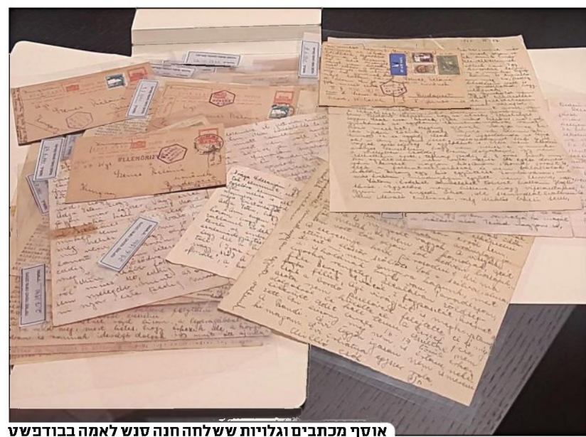
אוסף מכתבים וגלויות ששלחה חנה סנש לאמה בבודפשט