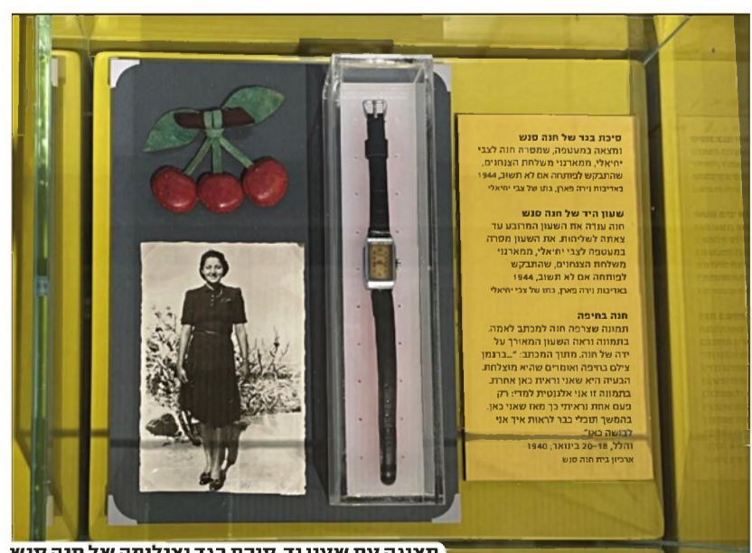
תצוגה עם שעון יד, סיכת בגד וצילומה של חנה סנש