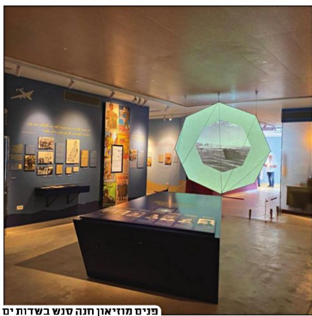
פנים מוזיאון חנה סנש בשדות ים

המועדות של חנה הייתה ברשימת 250 המתנדבים - והיא נבחרה בין ה-170 שהחילו בקורס להכשרתם. את הקורס סיימו 37 מתנדבים בלבד, בהם, כידוע, גם חנה סנש. בקבוצת הצנחנים שהוכשרו, היו שתי צניחניות נוספות: חביבה רייק ושרה ברורמן. חנה עברה הכשרה מיוחדת בהפעלת אלחוט, הצטיינה בצניחות הניסוי ושובצה עם עוד