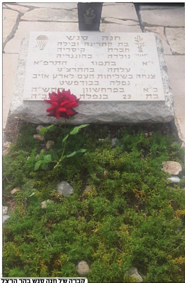
קברה של חנה סנש בהר הרצל