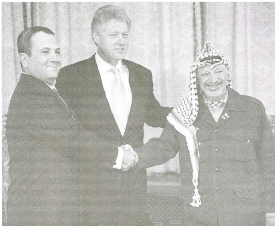
Кэмп-Дэвид, 2000 г. Билл Клинтон, Эхуд Барак и Ясир Арафат.