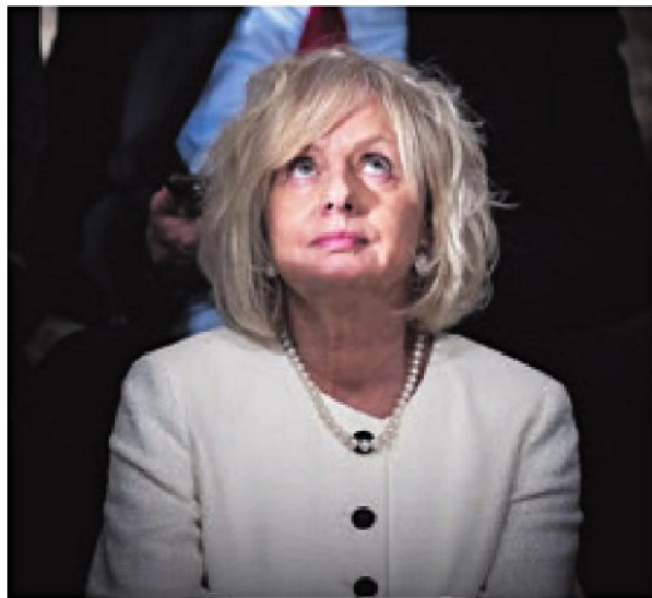
היועצת המשפטית לממשלה בהרב-מיארה. "היא דוגמה ומופת לשמירה על שלטון החוק וראויה לכל הערכה וכבוד"

כשזמיר מונה בספרו את התנאים שבהם מרי האזרחי מוצדק לדעתו, הוא כותב ששימוש בכלי הזה לגיטימי "רק אם ברור כי מחאה חברתית לא תספיק כדי לשנות את המצב". אלא שכיום, כמה חודשים אחרי שהספר ראה אור, ברור שבעוד זמיר מכיר בהישגי המחאה עד כה, הוא גם לא מתכחש לעובדה שהיא נחלשה מאז. "המחאה החברתית הביאה היש"ים וההפיכה נעצרה אבל לאחורונה היא התחדשה