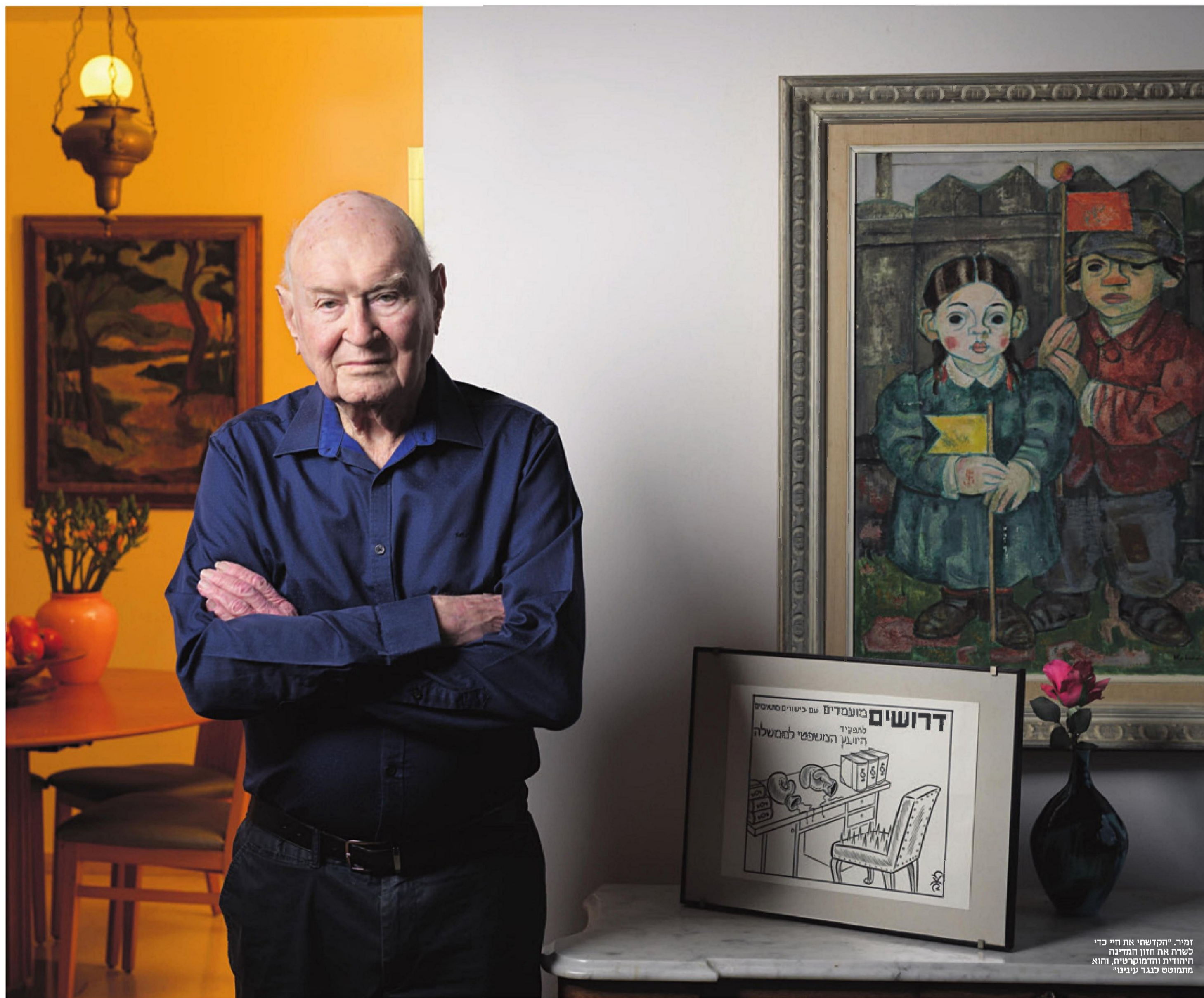
זמיר. "הקדשתי את חיי כדי לשרת את חזון המדינה היהודית והדמוקרטית, והוא מתמוטט כנגד עינינו"

"איני קורא למרי אזרחי. ההצדקה תלויה בתנאים במדינה ובהכרעה ערכית של כל אדם"