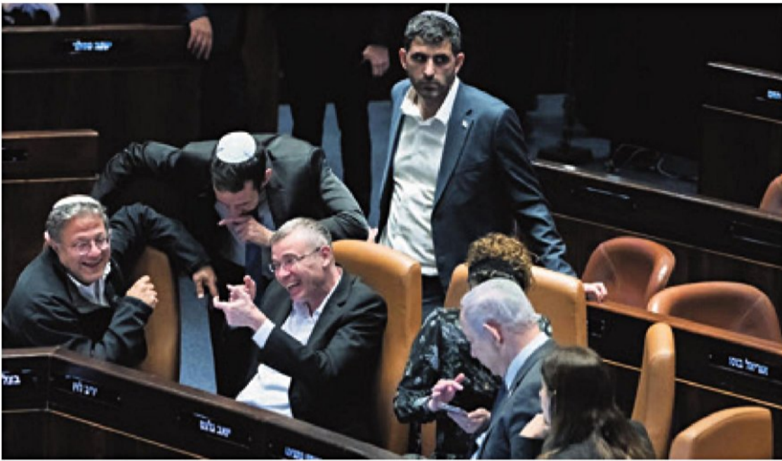
← נתניהו, קרעי, לוי (במרכז), ובן-גביר בכנסת, דצמבר 2023. "אנחנו כבר הרבה מעבר למשבר חוקתי"