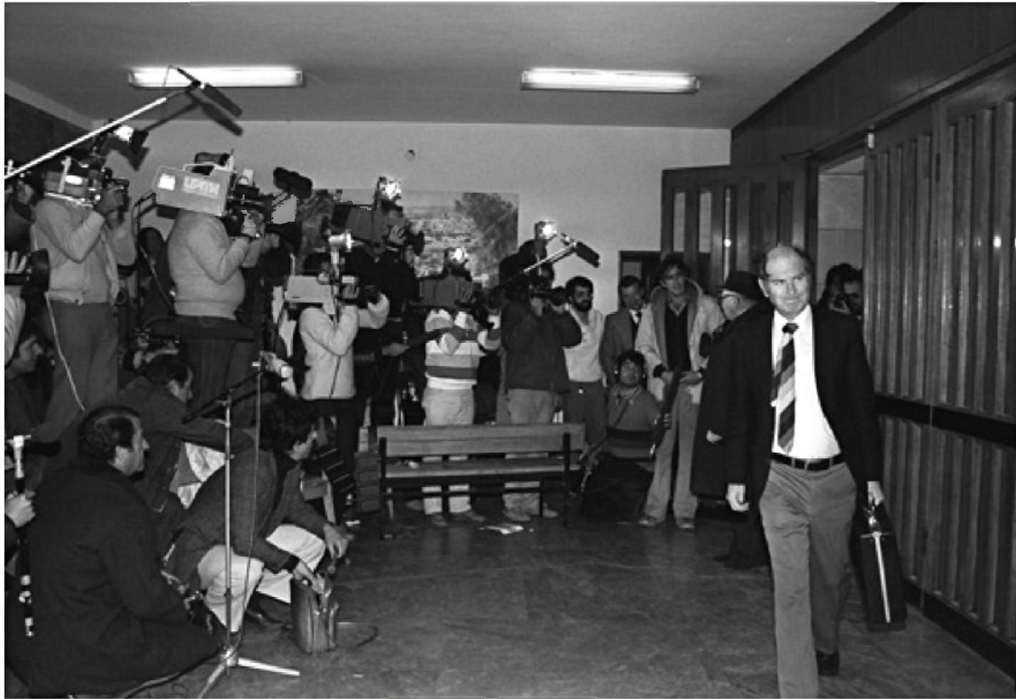
זמיר עוזב את משרד היועץ המשפטי לממשלה, 1986. פרשת קו 300 לימדה שאין במדינה גוף שעומד מעל החוק

שנחקקו במשך 75 שנה הגבילו בחלקם את השלטון והוא רוצה להשתחרר מהם. זאת המהפכה המשפטית שמאיימת למוטט את מערכת המשפט שנבנתה כאן מקום המדינה.