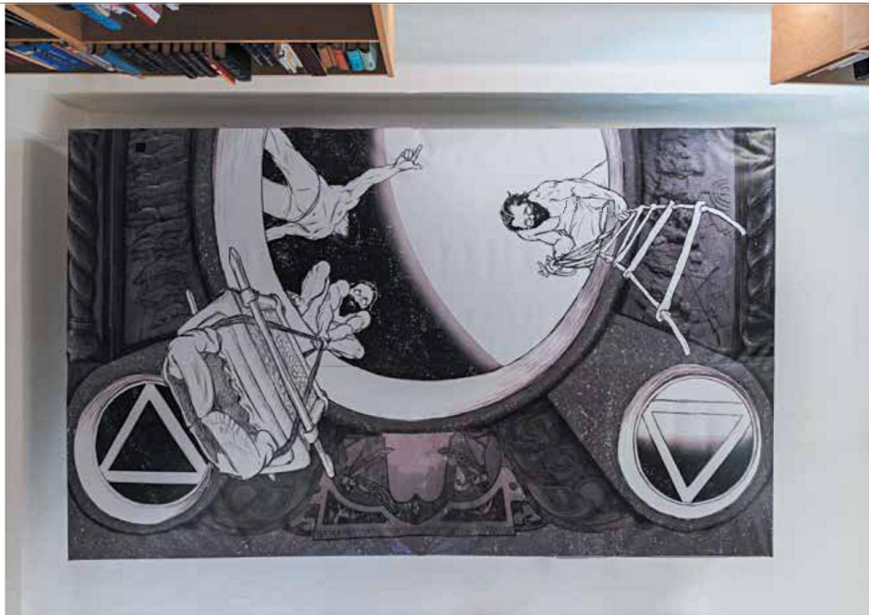
פורת סלומון, הנטישה, ציור דיגיטלי, 2022

שנזנחו עולמות תוכן שלמים, עושר ועומק של החומר נעזבו לטובת הדלות. הגיליון הבא של 'הי' יעסוק בנבואה, שהיא קודם כול פיתוח הדמיון. 'ביד הנביאים ארמה'. את זה גם הציבור הדתי שעדיין גלוטי צריך להבין: העולם היהודי מלא בחומר, כמגע עם החיים עצמם, ומתוך זה מגיעה הנבואה. כגמרא קיימת יצירתיות מטורפת, מלאה אגדות ודמיון. הכוח הספרותי והאמנותי חשוב כדי לבנות על גביו קומה ישראלית עליונה. יהדות של קדושה ויזואלית. הקצה של זה, שהוא גם מסוכן, מתבטא בעובדה שבקודש הקדשים עצמו קיימים הכרובים. החומר מביא איתו אמת, שמצריכה תיקון.