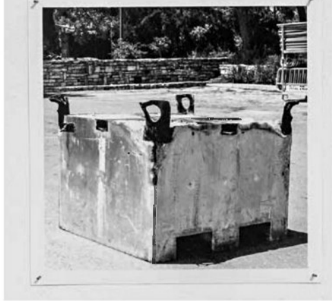
דוד (דוכי) כהן, מהסדרה "דת אזרחית", 2018. למעלה: שולחן לחם הפנים; למטה: מזבח