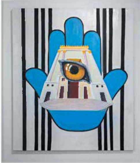
קלוד משה קמון, ללא כותרת, שמן על קנבס, 2005