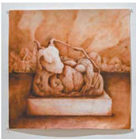
תהילה מלס, ללא כותרת, פיגמנט יבש על נייר, 2024

בערב שהתקיים בבית אצ"ג בליל תשעה באב תשפ"ג, 2023, רגע לפני המלחמה, הוקרא שיר כמעט נבואי בשם "ועז תיכבש בשנית", שכתב יוחאי שלום חדר, ובו שורות דוגמת "עוד נאסף את הקרפה שחשבנו שאפשר / להתנתק משערי עזה המלחמים לכתפינו", "ועיני ירדה דמעה / על גלדי הקוסם בלי הישנים פחיק אמן / בקפויץ, מושב או עירה / לא ירדעים שרמם נצרה קמרבד ארמון / - פי נמלא עוון עד הגה". מי יודע, אולי גם הפעם בגלריה גאולה שבבית אצ"ג מרחיקים ראות, הרבה מעבר לקו האופק המוגבל של אמנים אחרים. ●