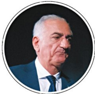
"אדם מרשים מאוד". רזא פלווי

"אני אופטימי לגבי הכלכלה. המשק שלנו מגיע לביצועים מדהימים אפילו כשאנחנו לא ישנים בלילה. ההכנסות האחרונות הפתיעו לטובה, ולכן גם הגירעון במצב סביר. ומה הלאה? עוד הפרטות, מדינה רוה ככל האפשר, צריך לצמצם את ההוצאה של מערכת הביטחון, וגם במשרדי ממשלה. 18 משרדים זה די והותר, והקיצוץ גם יזרו החלטות ויחסוך עוד כסף. עכשיו הכל תקוע".