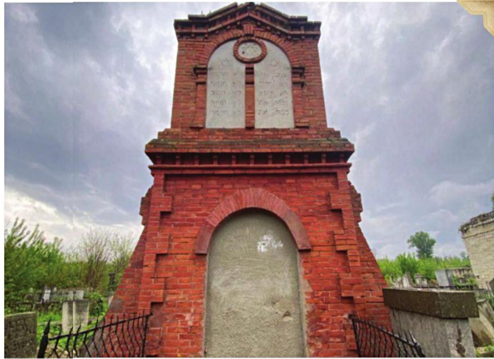
גלעד לזרחות. המבנה המרשים על קברו של הרב צירלסון בקישיב

ארץ אל תכסי דמם. קברו של הגאון ר' יהודה ליב צירלסון היידי שהתגלה לאחרונה