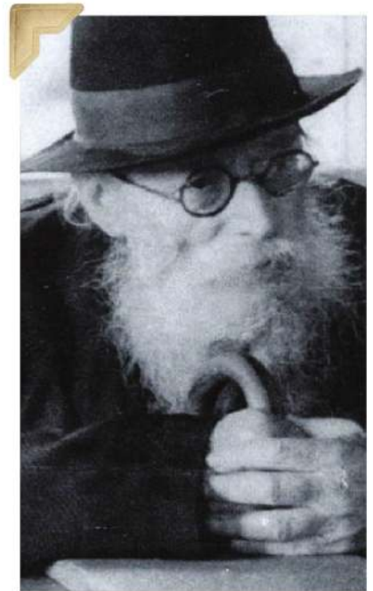
איר נסתר יחד? מר החזון איש זי"א

"עם כל השמחה שנשמח על משכה בסגולתה לגבולנו בנים שהתרחקו ממנו בורע נטויה קדימה - אי אפשר בכל זאת לבלתי הכיר עצמותה, שבאמת נה רק מלאכותית"