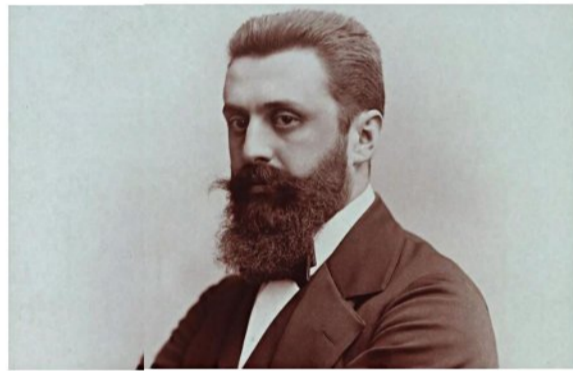
חזרה ליהדות, לא לשורשים. תיאודור הרצל

בכל דור ישנה התמודדות עם 'שתי תרופות' - אלו שמבקשים לרפא את המחלה באמצעות התנגדות לה ואלו שמנסים לחקות אותה