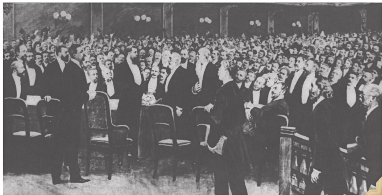
עם ככל העמים. הקונגרס הציוני

"ובכן אין לערוב המושגים. הציונות הצרופה יכולה להתקיים בלב ציוני אמתי גם בבלי היותה תלויה במחשבת מוחו של אודות הגאולה, בהיותן באמת שני עניינים נפרדים"