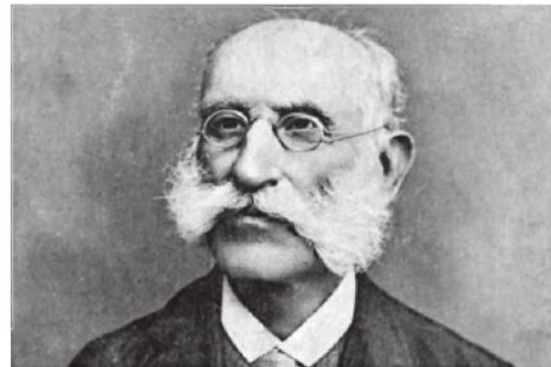
יהדות השרירים. מקס נרדא

"ובכן אין לערוב המושגים. הציונות הצרופה יכולה להתקיים בלב ציוני אמתי גם בבלי היותה תלויה במחשבת מוחו של אודות הגאולה, בהיותן באמת שני עניינים נפרדים"