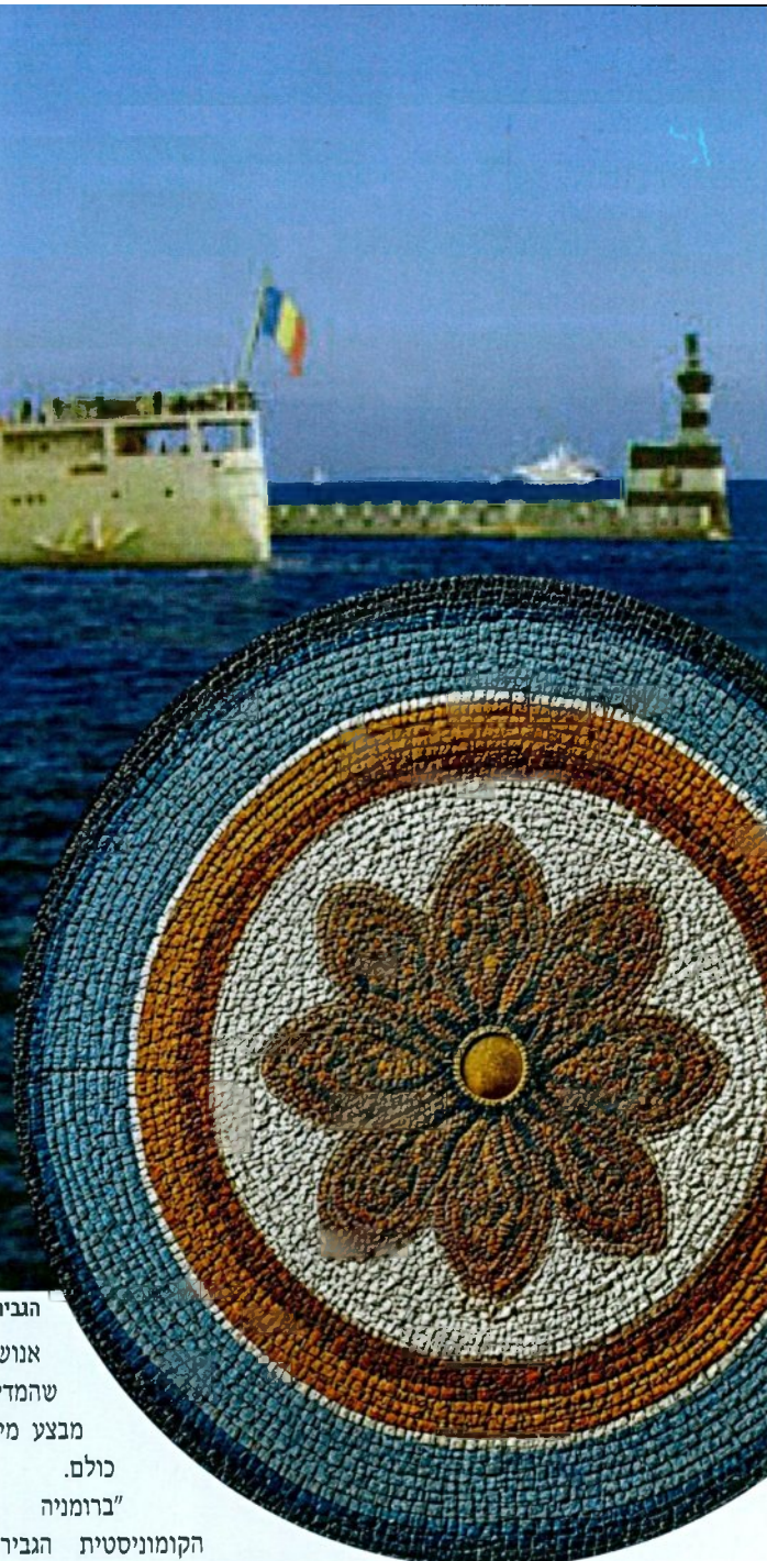
הגבירו את המסעות. האונייה טרנסילבניה

"במקביל, המצב בעיראק וברומניה לא אפשר המתנה. בעיראק חוקק חוק השולל אזרחות מיהודים שיצאו והוקצב לכך חלון זמן של שנה בלבד, ממרץ 1950 עד מרץ 1951. פצצה שנזרקה לבית קפה יהודי בבגדד בינואר 1951 האיצה את הלחץ. גזבר הסוכנות, לוי אשכול, אמר לשליח שלמה הלל: 'תאמר ליהודים שיבואו אבל לא ימהרו, אם יבואו יצטרכו לגור ברחוב'. בסופו של דבר נוצר לחץ