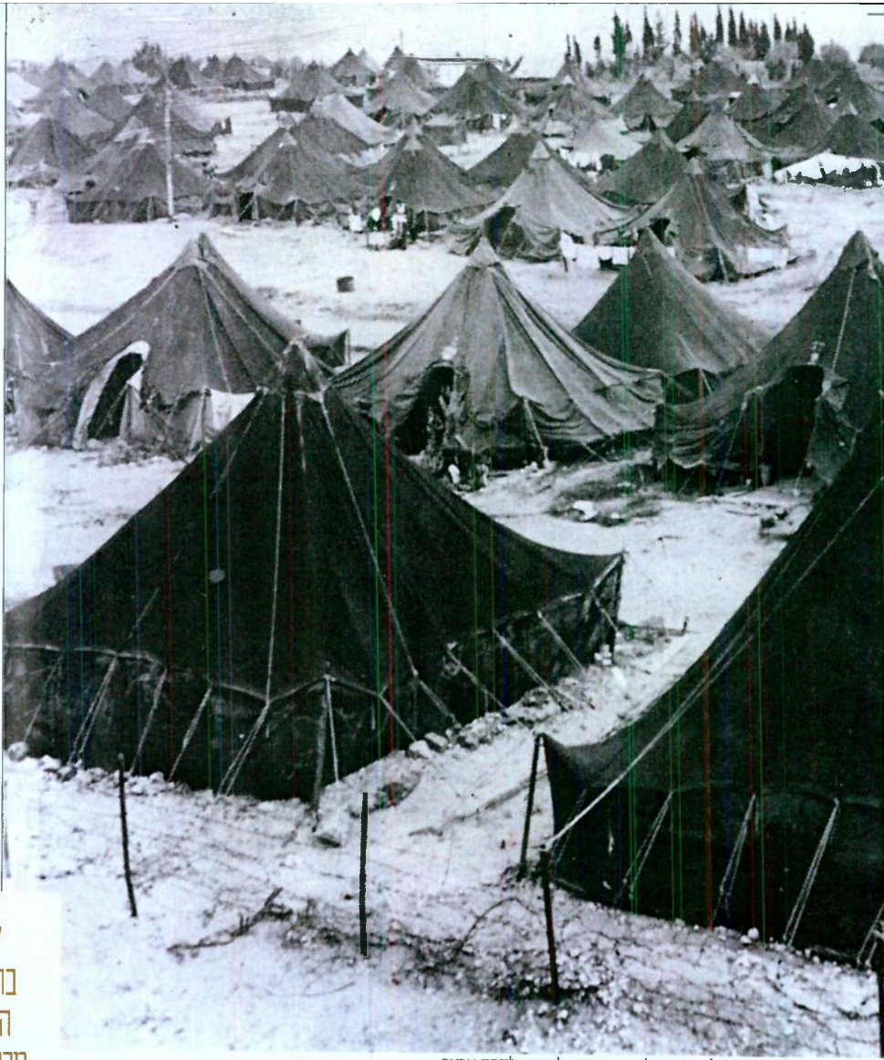
חיים רווי תלאות. העולים במעברות לאחר עלייתם ארצה

"היחס לעלייה בתנועה הציונית היה אמביוולנטי מראשיתה משום שהיא הציבה לעצמה שני יעדים שלעיתים התנגשו: הצלת היהודים מחד ובניין ארץ ישראל מאידך"