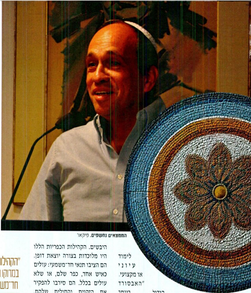
התמצאים נחשפים. פיקאר

חיסול גלויות תמוטט את מערכת הבריאות בארץ ותפגע בתושבים הוותיקים. שיבא רץ עם הנתונים האלה ישר לראש הממשלה, דוד בן-גוריון."